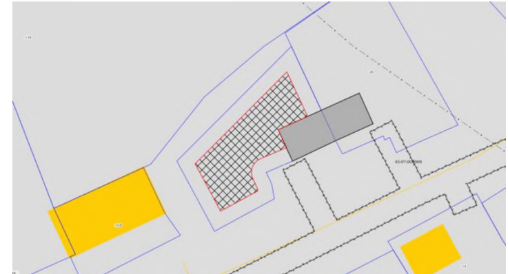
Ситуационный план до принятия решения

Испрашивается отклонение от предельных параметров разрешенной реконструкции существующего объекта в части изменения предельной минимальной величины отступа от границ земельного участка с кадастровым номером 45:07:030901:29 по адресу: Курганская область, Катайский район, с. Ильинское, ул. Западная, д. 40-2 с восточной стороны до 0 метров