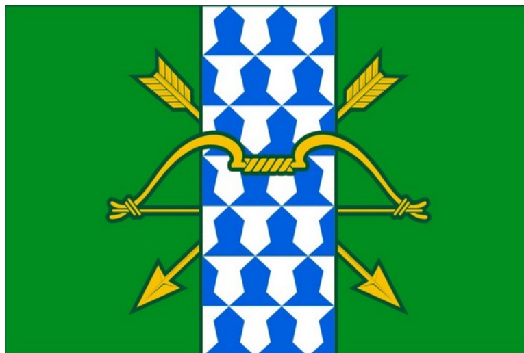
Флаг Катайского муниципального округа Курганской области в цвете

Председатель Думы Катайского муниципального округа