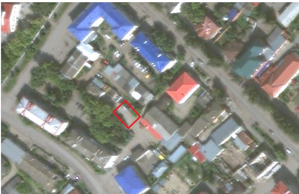
Схема размещения торговых мест на постоянно действующей универсальной ярмарки на территории Катайского муниципального округа Курганской области

Приложение 3 к Постановлению Администрации Катайского муниципального округа Курганской области от 17.10.2024 г. № 779 «Об утверждении Порядка организации деятельности постоянно действующей универсальной ярмарки и предоставления мест для организации ярмарок выходного дня юридическим лицам (индивидуальным предпринимателям) на территории Катайского муниципального округа Курганской области»